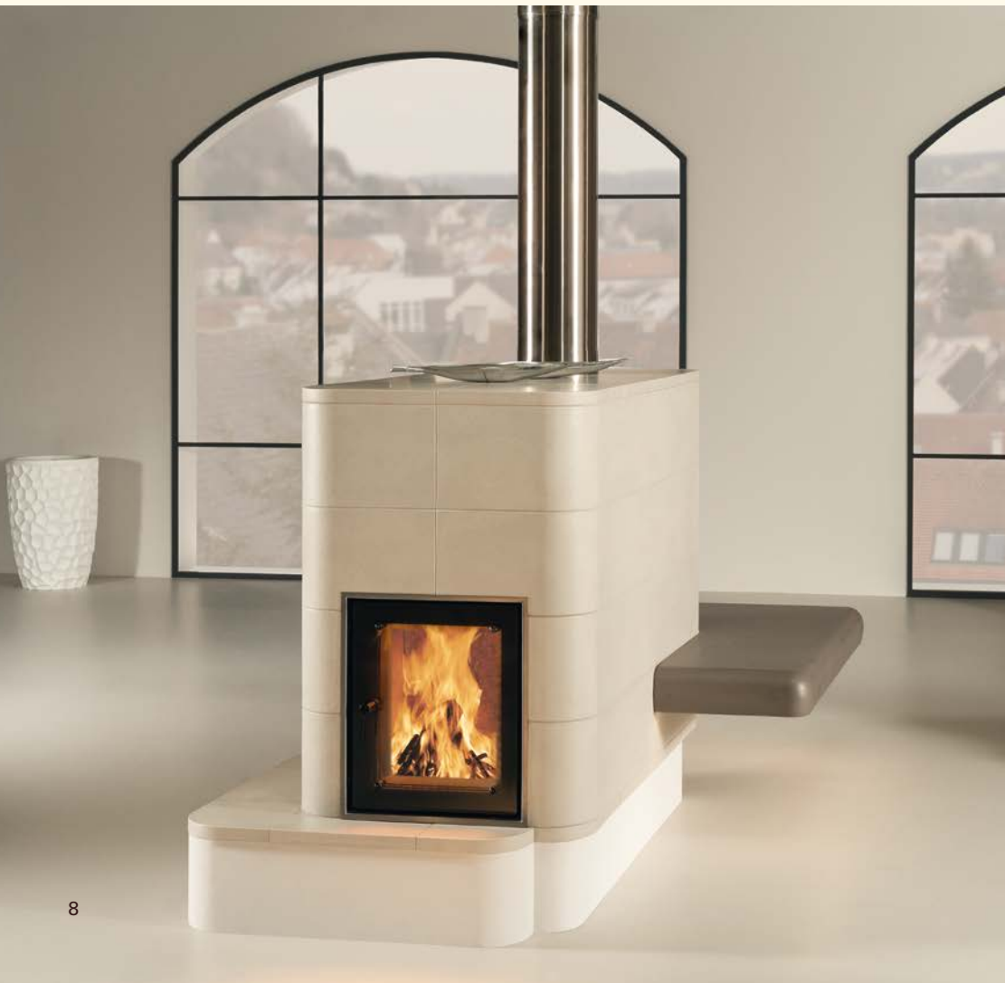
2092: Feuertisch Soft 177 Kachel 378, Plattsims 387 Glasur: taupe dunkel, taupe hell Technik: WGS KE 497

Die Reduktion auf das Wesentliche war schon immer eine besondere Herausforderung. Die großen keramischen Flächen ermöglichen die klare Umsetzung der Funktion des Wärmens. Es entsteht ein einzigartiges Raumgefühl durch KACHEL GANZ GROSS.