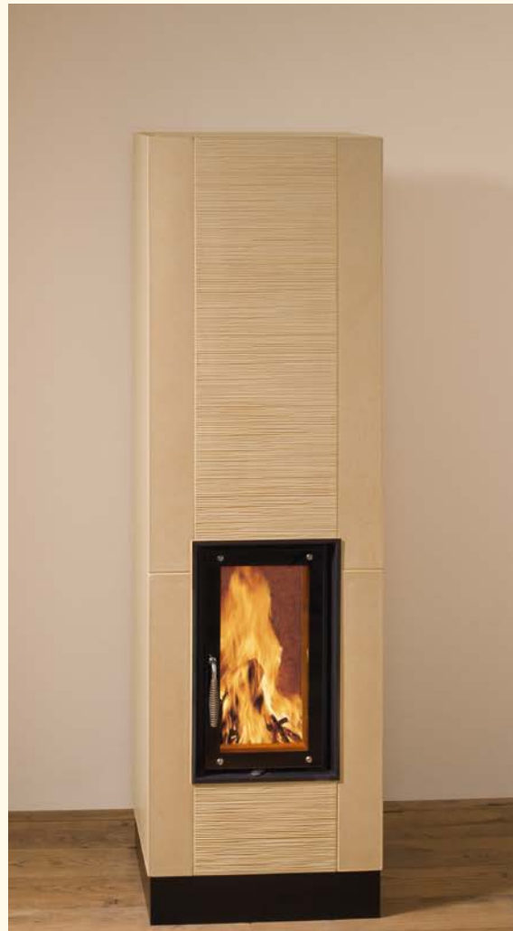
2072: Vollspeicherkerachelofen eckig Glasur: sahara