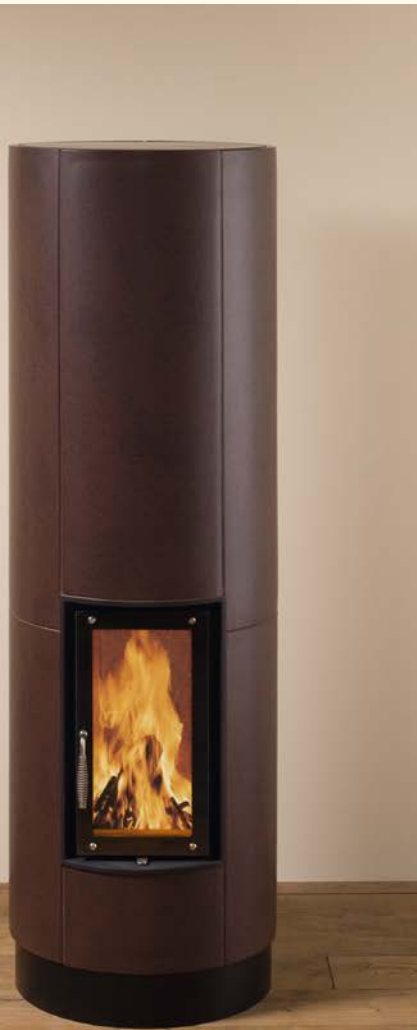
2071: Vollspeicherkerachelofen rund Glasur: umbra