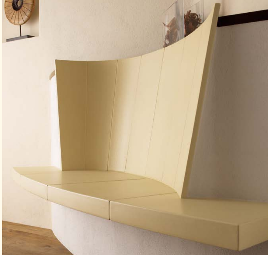
2047_1: Feuertisch 179 Rückenschild 378 Glasur: cacao dunkel, perla Technik: Brunner KE 351

„Die Entdeckung der Langsamkeit“ – ein wunderbares Buch. Sich Zeit nehmen um die Tätigkeiten des täglichen Lebens mit der Aufmerksamkeit zu verrichten, die ihnen gebührt – mit Freunden zusammensitzen und reden, ein Buch lesen oder gedankenverloren in das Feuer blicken. Tätigkeiten aus denen wir die Kraft für den Alltag schöpfen.