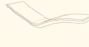
Chaice-longue sospesa (tra due pareti) Tête et pied de lit fixés au mur