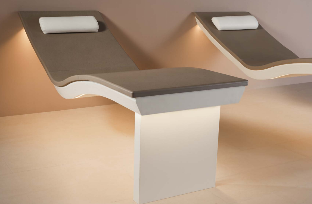
6027_2: Variante con piede d'appoggio indipendente, in smalto agave media Modèle avec pied de lit sur socle, glaçure agave moyen

Il calore radiante della maiolica del Lounger Two ha un forte potere rilassante. Il design fluttuante, le superfici setose e la forma ergonomica appagano la vista e il corpo.